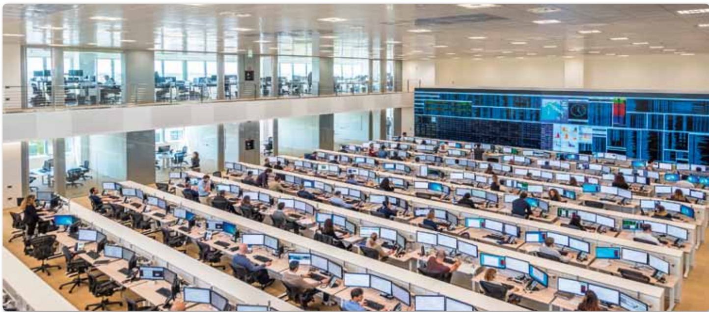
Network Operation Center di Welcome Italia a Montacchiello (PI)